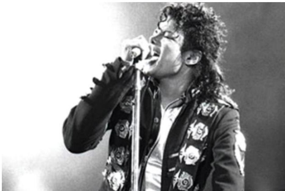
Майкл Джексон в 1980-х годах.

проблемы. Губернатор штата превращается в чернокожего и испытывает на себе все результаты расовой дискриминации. Согласитесь, что это напоминает судьбу популярного американского певца Майкла Джексона, который сменил цвет кожи, спасаясь от дискриминации.