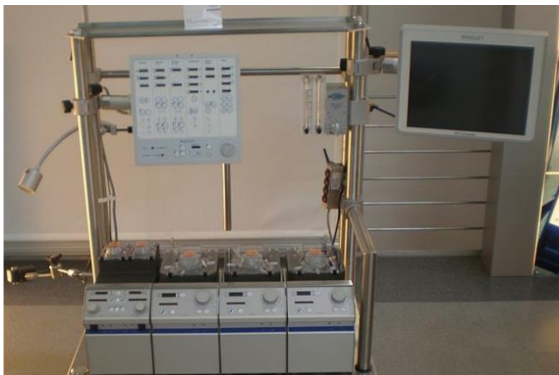
Аппарат искусственного кровообращения.

В книге «Властелин мира» (1926 год) описывается аппарат для передачи мыслей на расстояние по принципу радиоволн, по сути - создание психотропного оружия. Кроме того, там описаны беспилотные летательные аппараты, первые удачные испытания которых проведены в Великобритании лишь в 30-х годах прошлого века.