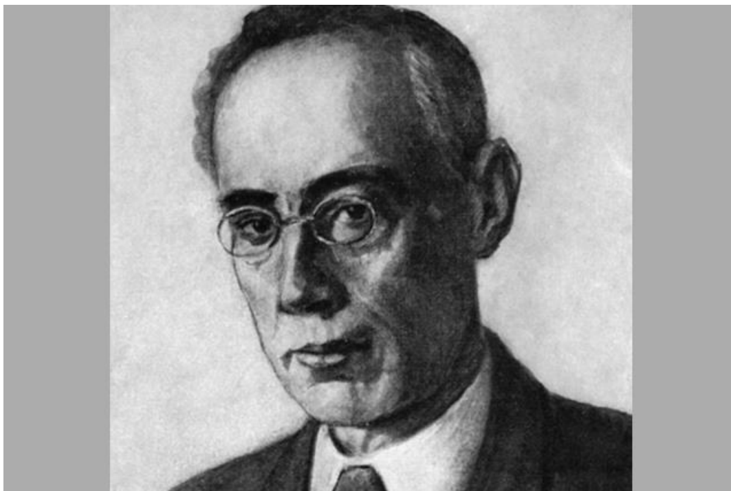
Писатель Александр Беляев

SMOL.AIF.RU подготовил подборку самых удивительных предсказаний смоленского Жюль Верна, которые были воплощены в жизнь.