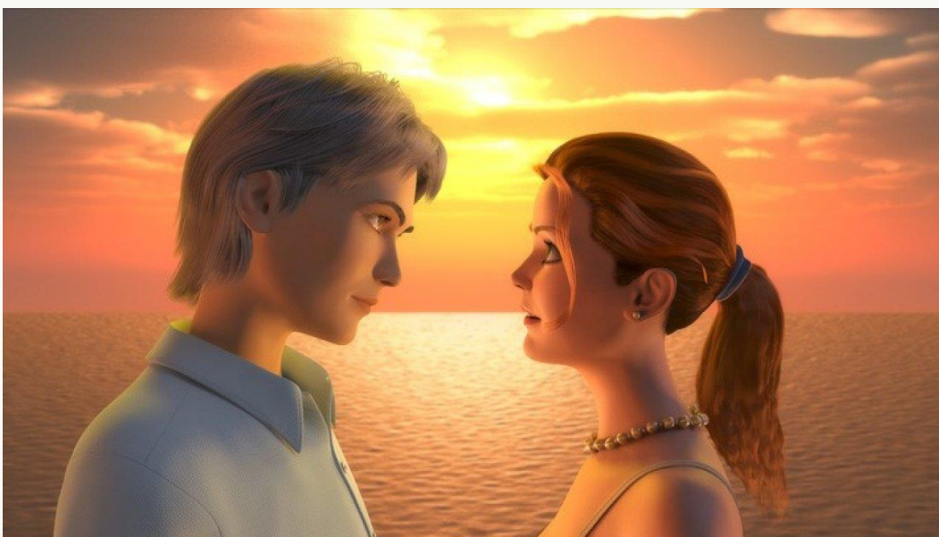
«Остров погибших кораблей» (1987) и «Дожди в океане» (1994)