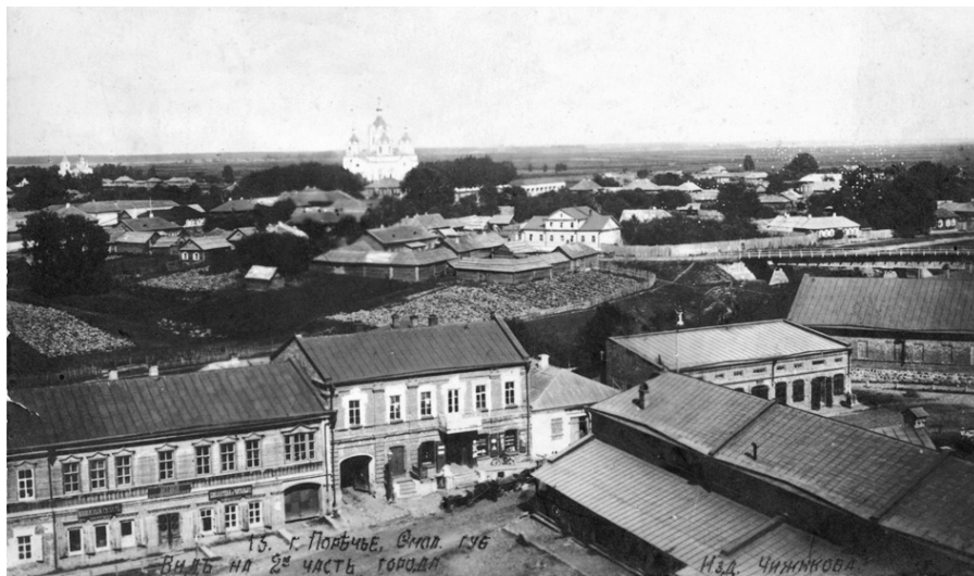
Вид на 2-ю часть г. Поречье. Почтовая карточка начала XX в.

впервые подметили, еще концертируя по городам в лазаретах. И нечего скрывать – мы, люди уже попривыкшие к сцене больших городов, старались сильно «подтянуться», сидя на лавках при концерте где-то в простой избе крестьянской в дер. Холм около Заборья. Наименьшим критическим художественным чутьем в деревне владеет – как и следовало ожидать – гармонист, специалист в частушке и той «срамоте», которыми, к сожалению, наводняется наша деревня. Коренное же, устойчивое сельское население, припоминающее традиции прежней, «до гармониста», деревенской песни оч[ень] легко и верно разбирается в преподносимом ему песенном материале, и эту часть сельских аудиторий приезжему артисту «штучками» не захватить, на пустячках не выехать.